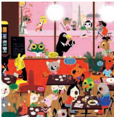
Mouk, Albin Michel

Les passerelles entre littérature de jeunesse et cinéma sont multiples : les adaptations d'albums ou de romans nourrissent les