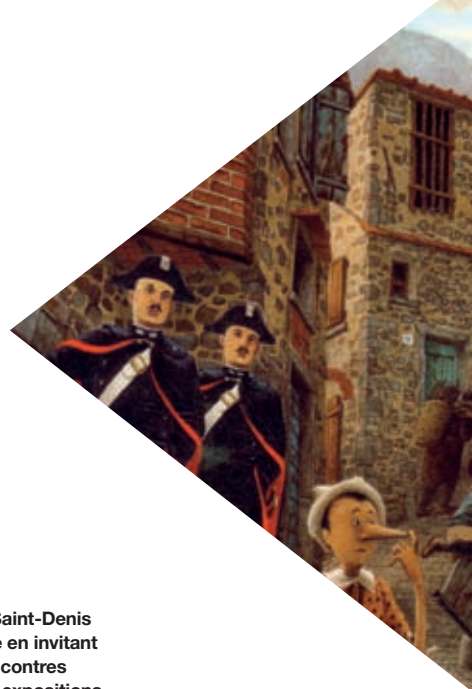
Les Aventures de Pinocchio Carlo Collodi & Roberto Innocenti Gallimard

Des rendez-vous à suivre sur www.salon-livre-presse-jeunesse.net